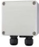
Bağlantı Kutusu (Kolay Elektriksel Bağlantı İçin)