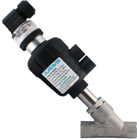
Mounted onto PPV-10P series angle seat valves

By the means of the red band inside the transparent cover; visual monitoring of the valve become possible.