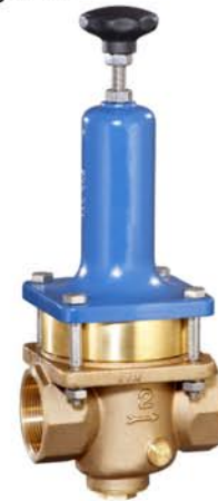
DN 32 - DN 50